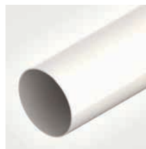
БЕЛЫЙ RAL 9010